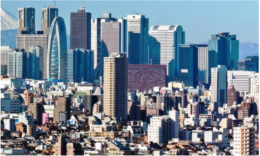
Tokyo in 2013

geweld valt op te tekenen. In de 18e en 19e eeuw groeide in Europa de gedachte dat de samenleving steeds verder vooruit zou gaan, altijd beter, gezonder, meer welvaart, meer vrede. Vooruitgangsgeloof als de religie van het meer, een geloof dat de samenleving zich naar steeds naar hogere stadia van volmaaktheid zou ontwikkelen, op weg naar de maakbaarheid van de samenleving en gedragen door het geloof in de menselijke rede zonder tussenkomst van religie. Dit vooruitgangsgeloof van de Verlichting wordt nu ingehaald door een opleven van radicale religieuze ideeën binnen de islamitische wereld, maar ook in andere godsdiensten. Intolerante en soms ook gewelddadige religieuze stromingen gedijen als nooit tevoren. Geweld en religie, de wereld levert een schrikbeeld aan gebeurtenissen, waarin religie en ideologieën als olie op het vuur zijn.