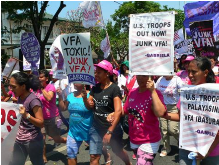
Demonstratie van GABRIELA in april 2013